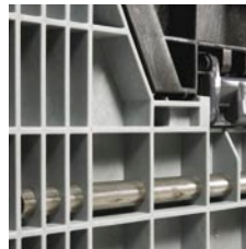
Oceľová tyč na vystuženie.