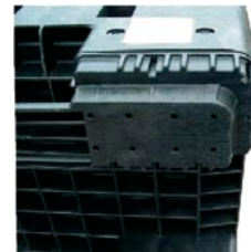
Vysoká stabilita pri stohovaní a preprave je zabezpečená samovystreďovacím stohovacím systémom.