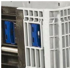
Uzáver bočných stien.